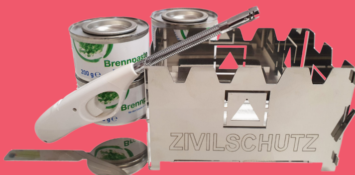
Zivilschutz-Notkochstelle 29,90 €

Informations- und Lichtquelle in einem. Strom- und batterie-unabhängig.