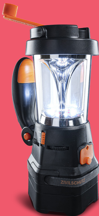
Notfallradio mit LED-Lampe 37,90 €

Informations- und Lichtquelle in einem. Strom- und batterie-unabhängig.